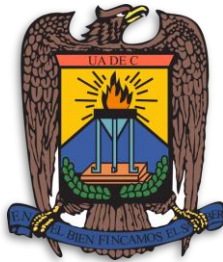
Universidad Autónoma de Coahuila