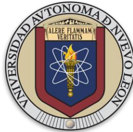
Universidad Autónoma de Nuevo León